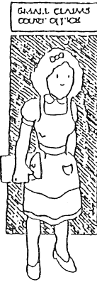
少額請求裁判所 村井

あなたは、あなたの訴訟原因 (Cause of Action) を分割することができることを覚えておきなさい。これは、一・